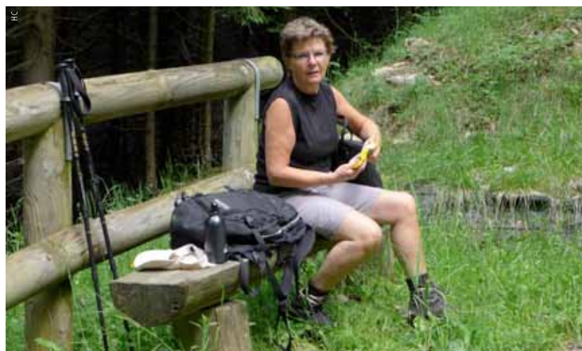
Zeventien kilometer wandelpaden, dan verwacht je wel eens een bank onderweg.

Met de provinciehoofdstad Trento en Rovereto op het programma wacht ons een drukke dag. Vóór alles gaan we in Trento kijken naar het kasteel Buonconsiglio, waar de katholieke kerk in 1545 een historisch concilie hield. Wat is ze heerlijk, die residentie van de prins-bisschoppen. En wat moet die zestiende-eeuwse kardinaal Bernardo Clesio een prestige hebben gehad. 'Zot van glorie,' zou wijlen mijn schoonmoeder hebben gezegd. De rondgang eindigt met een steile trap naar beneden. Over deze treden daalden in 1916 ook journalist-geograaf Cesare Battisti en zijn onderluitenant Fabio Filzi vanuit hun cellen de slotgracht in. Battisti voerde krachtig verzet tegen de Oostenrijkse overheersing en werd in een gevecht op de Monte >>>