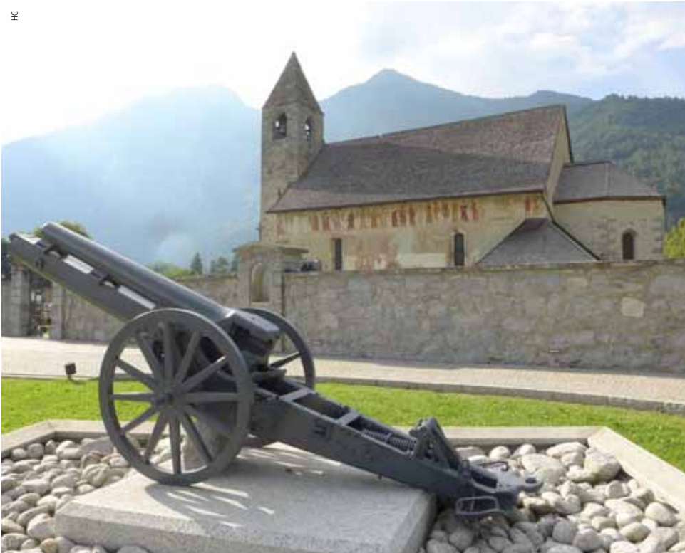
De kunstenaarsfamilie Baschenis liet nogal wat fresco's na op de kerken van Trentino.