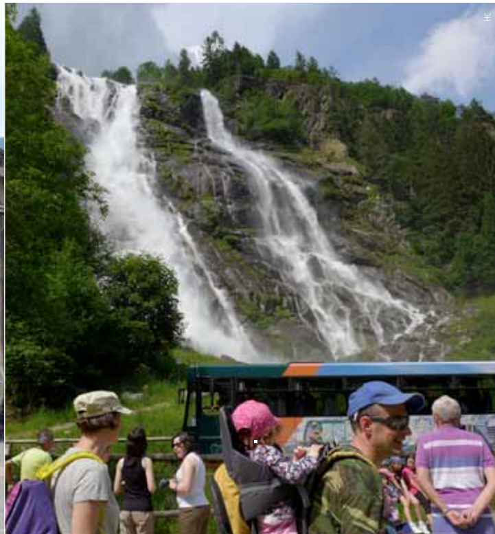
De Cascata Nardis buldert in de Val Génova.