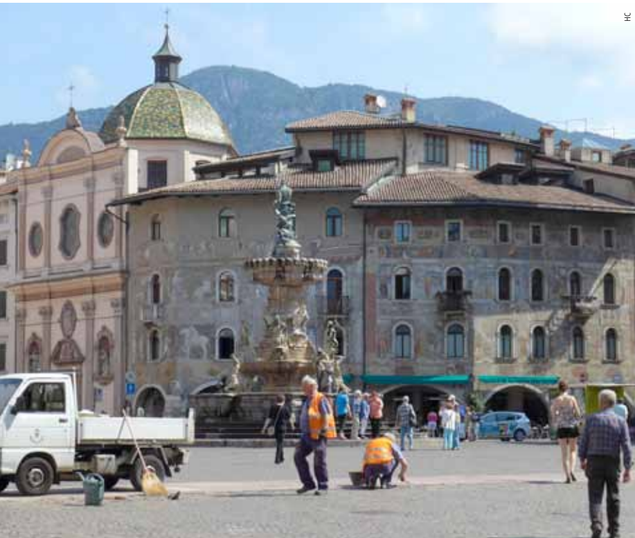
De Piazza Duomo met zijn Huis met de fresco's in Trento.