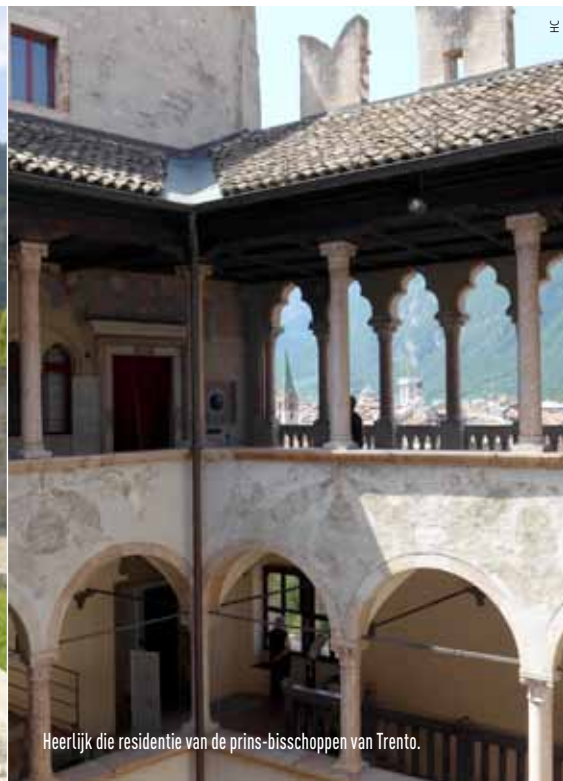
Heerlijk die residentie van de prins-bisschoppen van Trento.

dertiende vond ik in de bergen het kenteken van een gevallen soldaat. De oorlog werd voor mij tastbaar. Dat zwingelde mijn belangstelling aan. En zo ongeveer begon het voor de oprichters van dit museum. Zij vonden de resten van drie soldaten: twee Italiaanse alpini en één Oostenrijkse Kaiserjäger . Ze beslisten toen er voor te zorgen dat de herinnering aan deze oorlog nooit zou vervagen.'