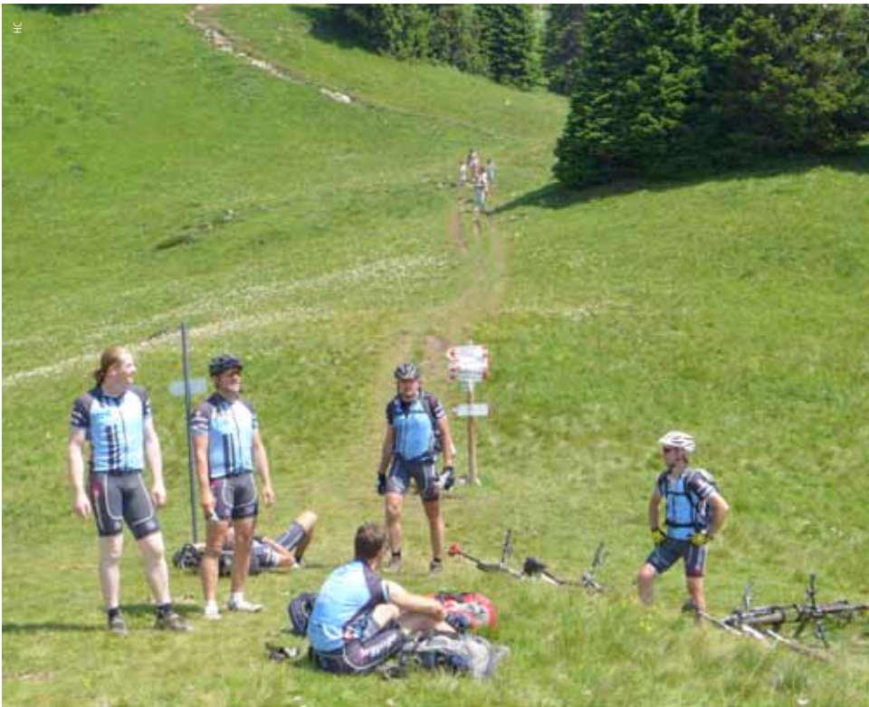
Ook mountainbikers leven zich uit in natuurrijk Trentino.

Corno gevat. Op 12 juli werden ze wegens hoogverraad samen opgeknoopt door de beul. In Trento missen we op een haar na het MuSe, het interactieve wetenschapsmuseum dat in juli 2013 opende en waarvoor architect Renzo Piano futuristische gebouwen ontwierp. Moeten we aanstrepen voor later! Gelukkig wacht ons - een halfuurtje naar het zuiden - Rovereto met zijn MART. Met dit museum van moderne en hedendaagse kunst beschikt de stad aan de Adige sinds tien jaar over een eersterangs culturele pool. Het wordt intens genieten in dat prachtig stuk architectuur van de Zwitser Mario Botta.